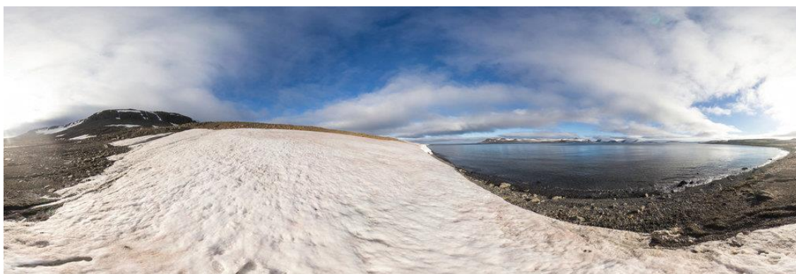
Рисунок 3. Панорамный снимок острова Куна, Земля Франца-Иосифа

Все цифровые платформы используют готовые аудио, видео и визуальные материалы. Их создание является не только самым сложным, но и наиболее дорогостоящим процессом. Команда специалистов должна выехать (вылететь) на место, провести панорамную фотосъемку, фотометрию, сделать аудиозаписи конкретных территорий, а затем исследовать отсканированные и смоделированные среды реального мира. Получается не просто набор 360-градусных панорамных фотографий, выстраивается определенный маршрут, локации на нем снимаются с помощью специализированного оборудования, позволяющего затем выполнять рендеринг в VR. Таким образом, формируется база из сотен терабайт информации.