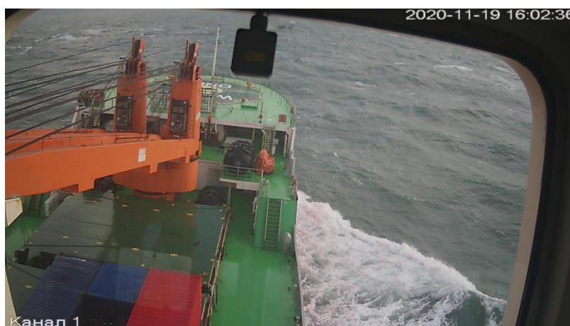
Рисунок 4. Фото с веб-камеры научного судна «Академик Трёшников»

В будущем приблизить арктический виртуальный тур к реальности сможет онлайн присутствие в части локаций. Примером может служить просмотр фотографий с веб-камер российских ледоколов, доступный на сайте http://194.190.129.43/ships/ . На карте выдается местонахождение нескольких судов по AIS. Поток видео нет, но фото с кормовой и носовой камер доступны через каждые 10–15 минут.