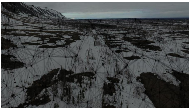
Рисунок 4. Наложение нейросети на фото с БПЛА территории Красные камни, Таймыр

В июне 2019 г. в ущелье Красные камни в начале плато Путорана на Таймыре в рамках реализации проекта создания туристического экоцентра туристско-рекреационного комплекса «Арктический» командой «Союза промышленников и предпринимателей Заполярья» совместно с техническими партнерами было проведено экспериментальное картографирование территории охватываемой зоны беспилотником (дроном) с камерой высокого разрешения и системой стабилизации. В последующем информация с дрона поступала на шлем виртуальной реальности 8 .