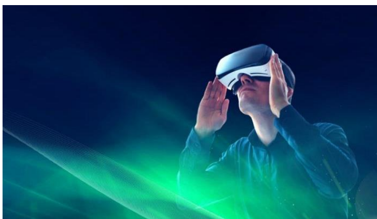
Рисунок 2. Использование VR для демонстрации изменения климата в Арктике

В настоящее время базовыми технологиями VR туризма являются: фотограмметрия (определение формы, размеров, положения объектов по фотографиям) и захват видео в 360 градусов. В России уже реализовано несколько интересных проектов с использованием VR и AR для популяризации Арктики.